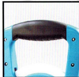
Heavy Duty Frame With Rubber Grip Handle