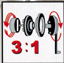
3:1 Gear Driven